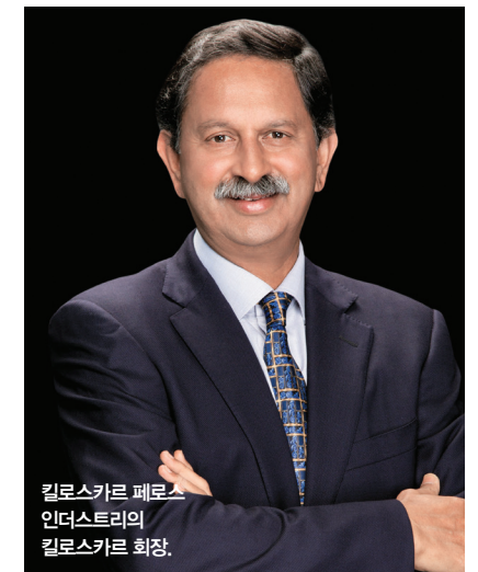
킬로스카르 페로스 인더스트리의 킬로스카르 회장.

2022 회계연도에 KFIL은 인도 심리스 메탈튜브(ISMT)의 지분 약 51%를 인수하여 경영권을 확보했다. 킬로스카르 회장은 이번 기업 인수에 대해 “우리의 제품 포트폴리오를 보다 전략적으로 확장할 수 있는 기회가 되었다. 인도 심리스 메탈튜브의 제품과 기술로 인해 우리는 이전보다 제품 구성을 더욱 다양화할 수